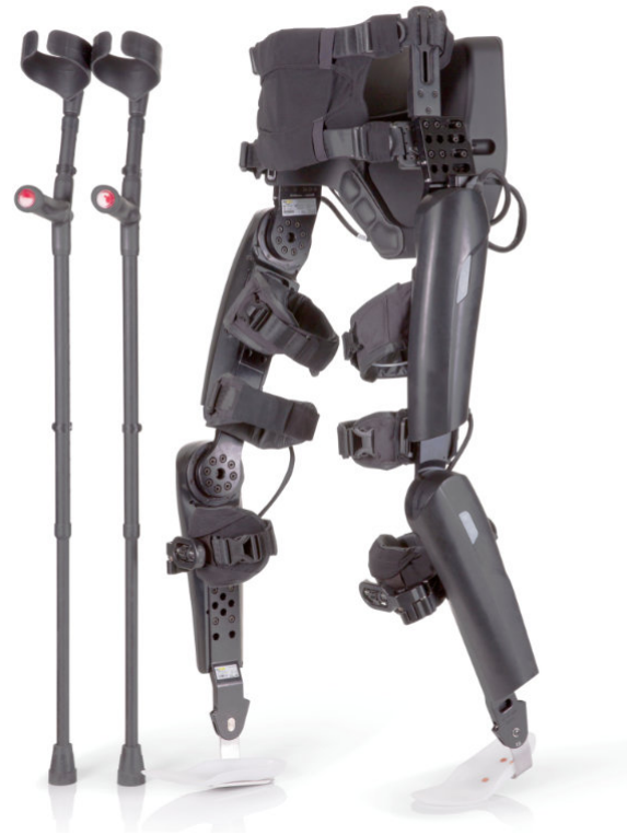
ReWalk Personal 6.0 System

ReWalk Robotics GmbH Leipziger Platz 15, 10117 Berlin